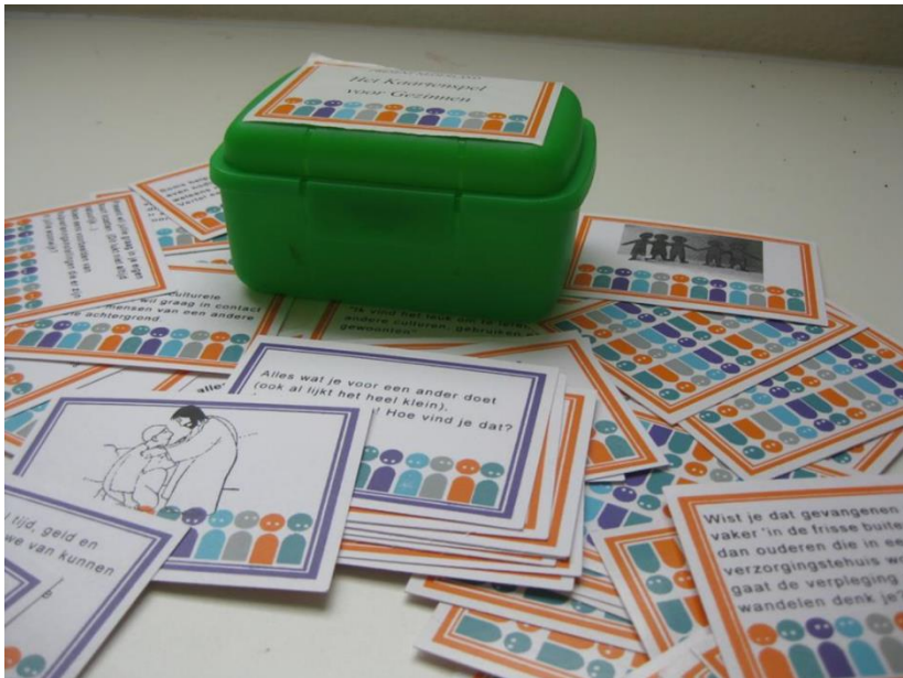
Voorgaande drie foto's zijn ontleend aan de Powerpointpresentatie bij het Present-Traject 'Adopteer een gezin of alleenstaande'