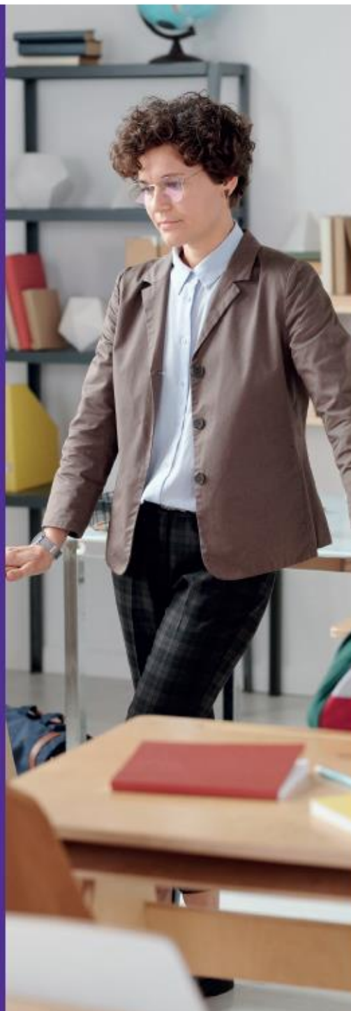
Persoonlijk Meesterschap en bekwaamheidsseisen

De verschillende aspecten van persoonlijk meesterschap hangen sterk met elkaar samen en grijpen op elkaar in. Voor het ontwikkelen en bespreken van het persoonlijk meesterschap kan op een bepaald aspect wel het accent worden gelegd.