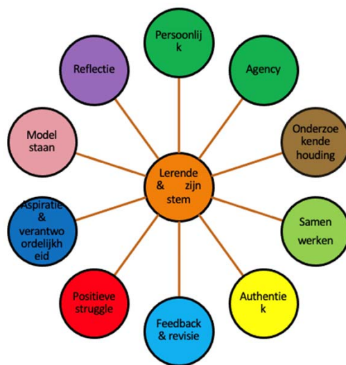
Figuur: Aspecten van ontwerpen, uitvoeren en evalueren van levenswaardig leren in een authentieke context.