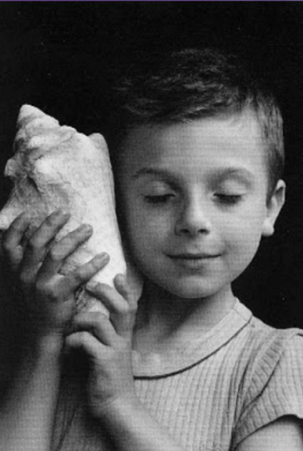
Imagen, Eduard Boubat