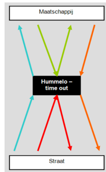
Figuur 1: Routes in en uit time-out

De hierboven genoemde en afgebeelde routes in en uit de time-outvoorziening leiden tot een aantal vragen. Hoe komt het dat er een positieve uitstroom is (pijlen blauw en groen)? Hoe komt het dat er sprake is van een negatieve uitstroom (pijlen rood en oranje)? En wat voor rol spelen hulpverleners, vakantievrijwilligers en de netwerkvrijwilligers in dit alles? Welke motivatiemiddelen worden ingezet om de cliënten weer op weg te helpen?